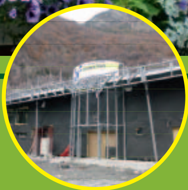
Page 8 Les travaux