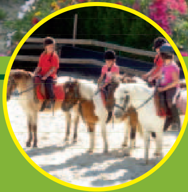
Page 12 à 21 Les associations