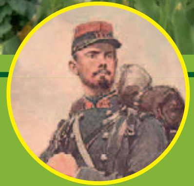
Page 24 Histoire